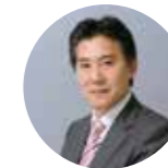
辻・本郷 税理士法人 副理事長