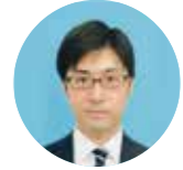
東京事務所 法人ソリューショングループ 上場・ファンド担当