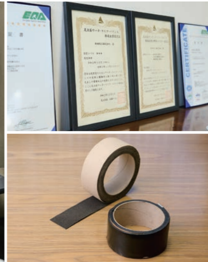
改質アスファルトのシート化