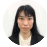
新宿ミライナタワー事務所 法人ソリューショングループ 組織再編・資本政策担当