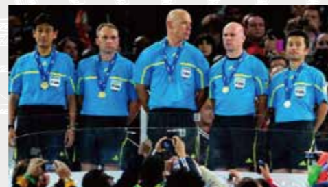
2010年南アフリカW杯決勝にて予備審判を担当

その後31歳でプロのお誘いを受け、ワールドカップやオリンピックなどの大会に行かせていただきましたが、45歳での契約満了も最初から決まっていた。引退後を考えてどり着いた答えが「税理士試験」。頭が良くないのは自覚していたので15年位での取得は現実的だと判断し必死に勉強しましたが、結果としてピッタリ15年で合格。自分の頭の程度の判断は合っていたようです。