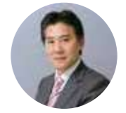
社・本郷 税理士法人 副理事長