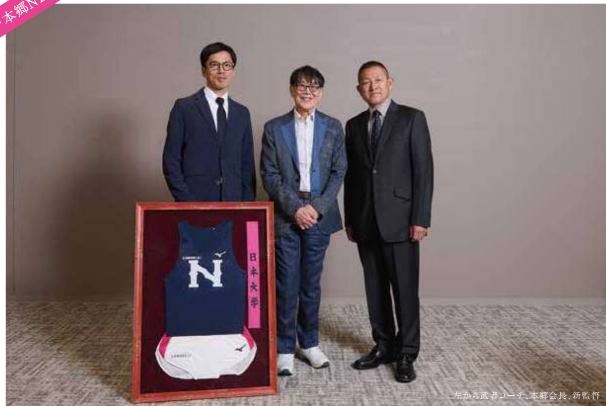
左から武者コーチ、本郷会長、新監督