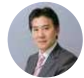
辻・本郷 税理士法人 副理事長