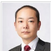
辻・本郷 司法書士法人 代表社員